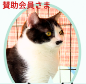
ふうくん 5月生まれ ワクチン接種手術済 甘えん坊で可愛いです

コアワクチン接種・駆虫レボリユーション済 月齢経過した猫は、血液検査・避妊手術済