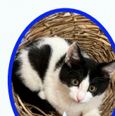
エメくん 10月上旬生まれ ワクチンレボ血液検査手術済