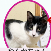
やんかちゃん 7月上旬生まれ ワクチン血液検査手術済