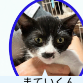
まていくん トライアル中