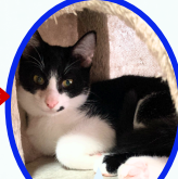
かかおくん 4月下旬生まれ ワクチン血液検査手術済