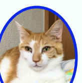
ほたるくん 10月未生まれ ワクチン血液検査済