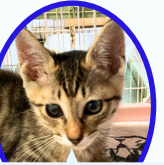
みーくん 5月中旬生まれ ワクチン血液検査手術済