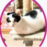
サブレちゃん 4月下旬生まれ ワクチン血液検査手術済