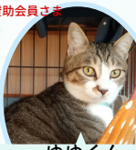
ゆゆくん 4月下旬生まれ ワクチン血液検査手術済 とみるくんと仲良しです