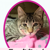
テックちゃん 9月中旬生まれ コアワクチン済血液検査手術済