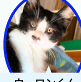
ウーロンくん 6月上旬生まれ ワクチン血液検査手術済