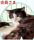
みいくん 5月生まれ ワクチン接種手術済 甘えん坊でいい子です