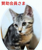
レアくん 4月生まれ コアワクチン血液検査レボ済