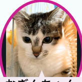
おぎんちゃん 1才9月下旬生まれ ワクチン接種済避妊手術済