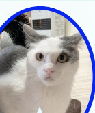
ころたんくん 8月上旬生まれ ワクチンレボ済