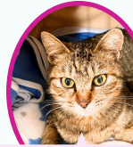
ハンちゃん 6月上旬生まれ ワクチン血液検査手術済