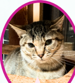
蟬丸ちゃん 8月上旬生まれ コアワクチン済血液検査手術済