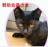
クロちゃん 5月生まれ ワクチン接種手術済