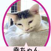
幸ちゃん 9月上旬生まれ コアワクチン済レボ済