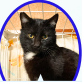
かくさん 1才9月下旬生まれ ワクチン接種済避妊手術済