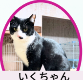
いくちゃん 6月下旬生まれ ワクチン血液検査手術済 コロナフリー化済