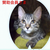
ノアくん 4月生まれ コアワクチン血液検査レボ済

賛助会員様が保護している猫ちゃんも 含め、個別対応にて面会可能です！ お気軽にお問合せ下さい