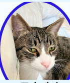
モクくん 4月中旬生まれ ワクチン血液検査手術済