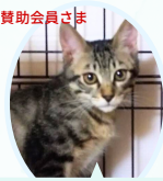
トアくん 4月生まれ コアワクチン血液検査レボ済