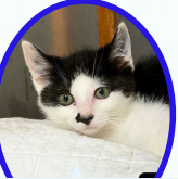
男爵くん 4月中旬生まれ ワクチン血液検査手術済 コロナフリー化済み