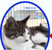
けろたんくん 8月上旬生まれ ワクチンレボ済