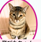
飛び丸ちゃん 8月上旬生まれ コアワクチン済血液検査手術済