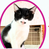
カナレちゃん 4月下旬生まれ ワクチン血液検査手術済