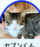
セブくん 6月下旬生まれ ワクチン血液検査手術済 PIPドライ寛解 元気です