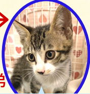
せんべいくん 7月中旬生まれ コアワクチン済