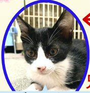
がじらくん 7月中旬生まれ コアワクチン済