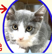
家康くん 7月下旬生まれ コアワクチン済