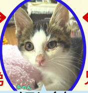
メロンくん 5月下旬生まれ コアワクチン接種済