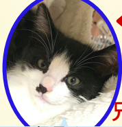
信長くん 7月下旬生まれ コアワクチン済