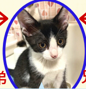
あられくん 7月中旬生まれ コアワクチン済