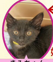
きみちゃん 6月19日生まれ コアワクチン接種済