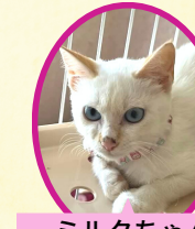
ミルクちゃん 5月下旬生まれ コアワクチン済