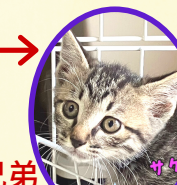
さけくん 4月上旬生まれ コアワクチン接種済 去勢手術済