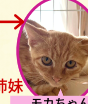
モカちゃん 5月下旬生まれ コアワクチン済