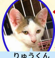
りゅうくん 5月下旬生まれ コアワクチン接種済 去勢手術済