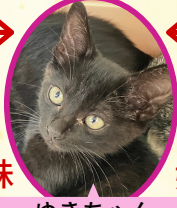
ゆきちゃん 6月19日生まれ コアワクチン接種済