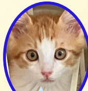
アポロくん 5月中旬生まれ コアワクチン接種済 去勢手術済