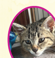
ふくちゃん 4月下旬生まれ コアワクチン接種済 避妊手術済