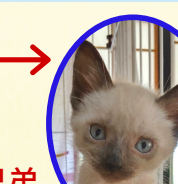
しろくん 5月中旬生まれ コアワクチン接種済