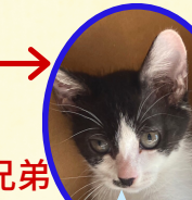
マックくん 5月中旬生まれ コアワクチン接種済 去勢手術済