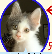
いちごくん 5月下旬生まれ コアワクチン接種済