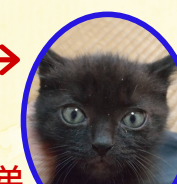
くろくん 5月中旬生まれ コアワクチン接種済