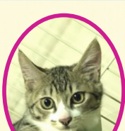
ラテちゃん 4月中旬生まれ コアワクチン済