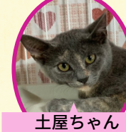
土屋ちゃん 5月中旬生まれ コアワクチン接種済 避妊手術済