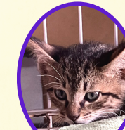
さんまくん 4月上旬生まれ コアワクチン接種済 去勢手術済