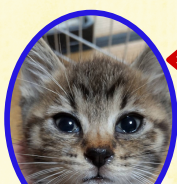
ぎんくん 5月中旬生まれ コアワクチン接種済