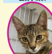
びいちゃん 4月中旬生まれ コアワクチン駆虫済 避妊手術済