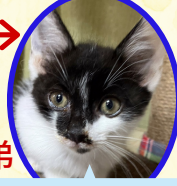
チェリーくん 5月下旬生まれ コアワクチン接種済