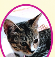
しまちゃん 6月上旬生まれ コアワクチン済 避妊手術済