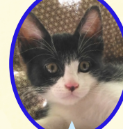
れいくん 7月上旬生まれ コアワクチン接種済