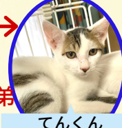
てんくん 5月下旬生まれ コアワクチン接種済 去勢手術済