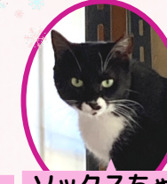
ソックスちゃん 1歳 避妊済