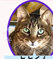
ととくん 13歳位 去勢済