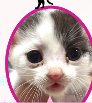
マリリンちゃん 10月下旬生まれ