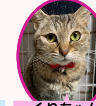
くりちゃん 2歳位 避妊済