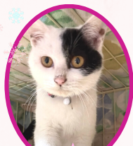
エースちゃん 10月中旬生まれ