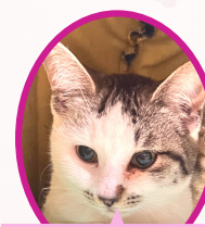
パピコちゃん 10月上旬生まれ