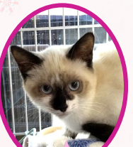
ツナちゃん 9月下旬生まれ