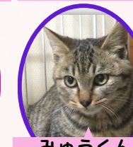
みゆうくん 2歳 去勢済