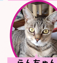
らんちゃん 2歳 避妊済み