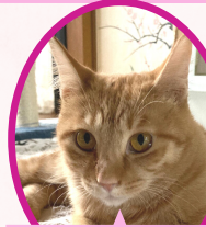
きいちゃん 5月上旬生避妊済