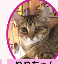
りりちゃん 1歳 避妊済