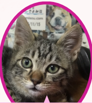
こねちゃん 11月中旬生まれ