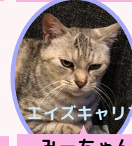
みーちゃん 6歳 避妊済み