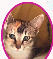
もうちゃん 10月上旬生まれ