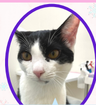
ゴマくん 8月上旬生まれ