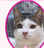
くーちゃん 5月上旬生避妊済