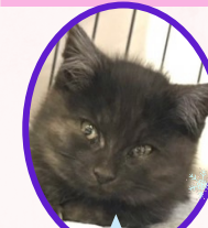
ろくくん 9月下旬生まれ