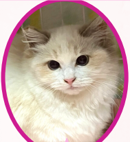
小雪ちゃん 9月下旬生避妊済