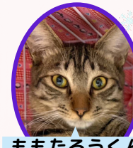
ももたろうくん 4月上旬生去勢済