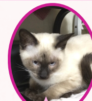
うめちゃん 9月下旬生まれ