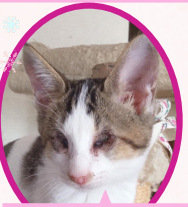
アイちゃん全盲 8月上旬生まれ