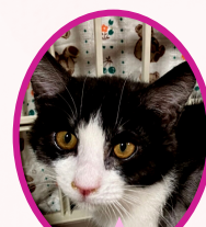
こぶちゃん 9月下旬生まれ