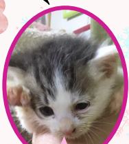
みはるちゃん 12月中旬生まれ