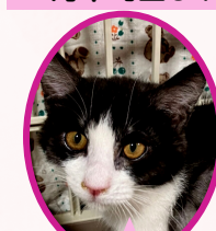
こぶちゃん 9月下旬生まれ