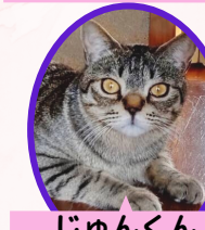
じゅんくん 2歳 去勢済