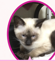
うめちゃん 9月下旬生まれ