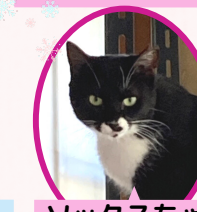
ソックスちゃん 1歳 避妊済