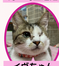
イヴちゃん 1歳 避妊済み