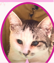
パピコちゃん 10月上旬生まれ