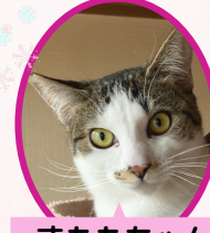
すももちゃん 4月上旬生避妊済