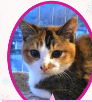
ミントちゃん 9月下旬生まれ