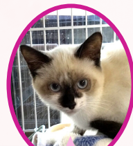
ツナちゃん 9月下旬生まれ