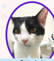
ゴマくん 8月上旬生まれ