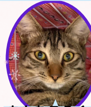
ももたろうくん 4月上旬生去勢済