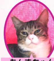
あんずちゃん 4月上旬避妊済