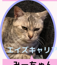
みーちゃん 6歳 避妊済み