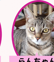
らんちゃん 2歳 避妊済み