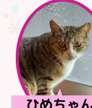
ひめちゃん 2歳 避妊済み