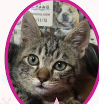
こねちゃん 11月中旬生まれ