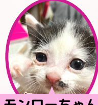
モンローちゃん 10月下旬生まれ