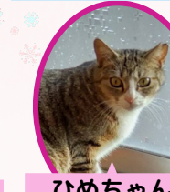
ひめちゃん 2歳 避妊済み