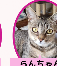
らんちゃん 2歳 避妊済み