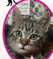
こねちゃん 11月中旬生まれ