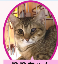
りりちゃん 1歳 避妊済