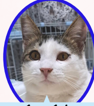
くーくん 5月上旬生避妊済