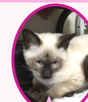
うめちゃん 9月下旬生まれ