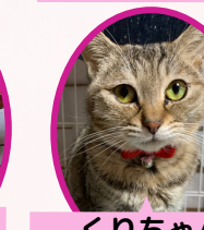
くりちゃん 2歳位 避妊済