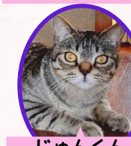
じゅんくん 2歳 去勢済