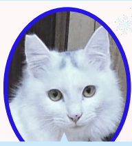
しーくん 5月上旬生避妊済