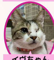
イヴちゃん 1歳 避妊済み