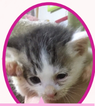
みるちゃん 12月中旬生まれ