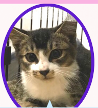
ピノくん 9月下旬生まれ