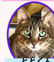
ととくん 13歳位 去勢済