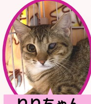
りりちゃん 1歳 避妊済