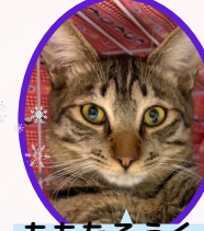
ももたろうくん 4月上旬生去勢済