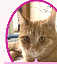
きいちゃん 5月上旬生避妊済