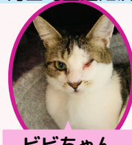
ビビちゃん 1歳 避妊済み