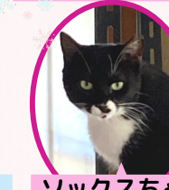
ソックスちゃん 1歳 避妊済