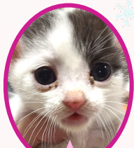
マリリンちゃん 10月下旬生まれ