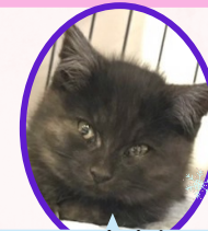
ろくくん 9月下旬生まれ