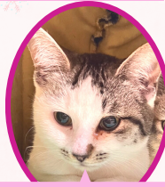
パピコちゃん 10月上旬生まれ