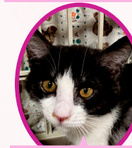
こぶちゃん 9月下旬生まれ