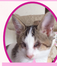
アイちゃん全盲 8月上旬生まれ