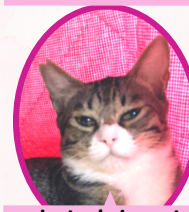
あんずちゃん 4月上旬避妊済