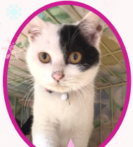
エースちゃん 10月中旬生まれ