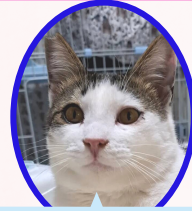
くーくん 5月上旬生避妊済