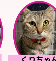
くりちゃん 2歳位 避妊済