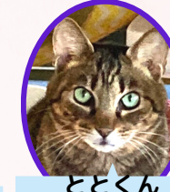
ととくん 13歳位 去勢済