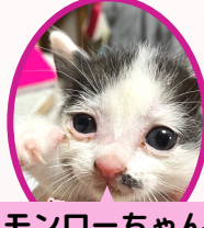
モンローちゃん 10月下旬生まれ