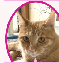
きいちゃん 5月上旬生避妊済