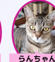
らんちゃん 2歳 避妊済み