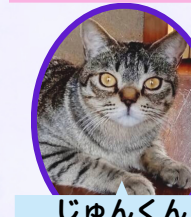
じゅんくん 2歳 去勢済