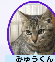
みゆうくん 2歳 去勢済