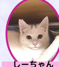
しーちゃん 5月上旬生避妊済