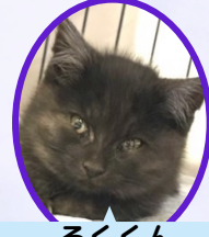
ろくくん 9月下旬生まれ