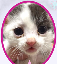
マリリンちゃん 10月下旬生まれ