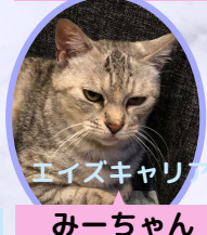
みーちゃん 6歳 避妊済み