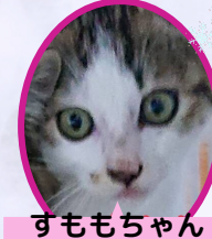
すももちゃん 4月上旬生避妊済