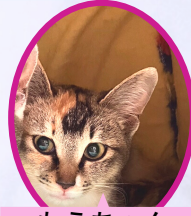
もうちゃん 10月上旬生まれ