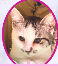
パピコちゃん 10月上旬生まれ