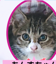
あんずちゃん 4月上旬避妊済