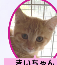
きいちゃん 5月上旬生避妊済