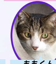
ももくん 13歳位 去勢済