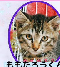
ももたろうくん 4月上旬生去勢済