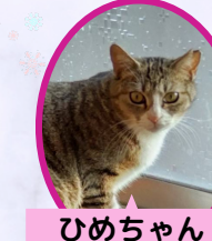
ひめちゃん 2歳 避妊済み