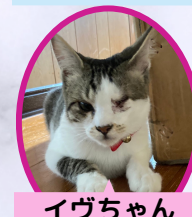
イヴちゃん 1歳 避妊済み