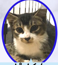
ピノくん 9月下旬生まれ