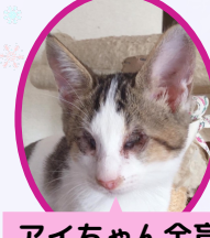
アイちゃん全盲 8月上旬生まれ