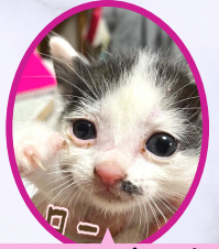
モンローちゃん 10月下旬生まれ