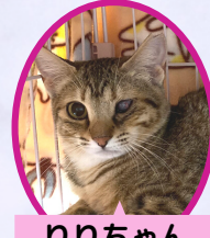
りりちゃん 1歳 避妊済