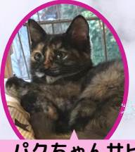
パクちゃんサビ 9月下旬生まれ