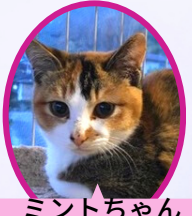
ミントちゃん 9月下旬生まれ