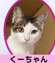
くーちゃん 5月上旬生避妊済