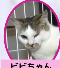
ビビちゃん 1歳 避妊済み