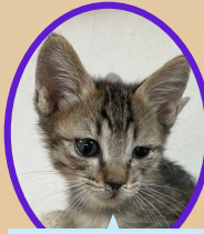
ぼっちくん 8月上旬生まれ