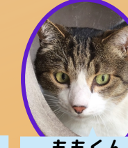
ももくん 13歳位 去勢済