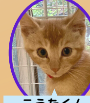
こうたくん 5月上旬生去勢済