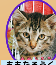
ももたろうくん 4月上旬生去勢済