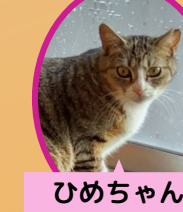
ひめちゃん 2歳 避妊済み