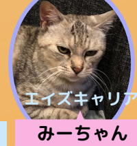
みーちゃん 6歳 避妊済み