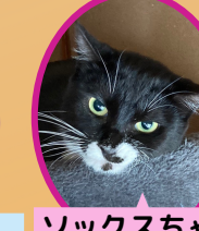
ソックスちゃん 1歳 避妊済