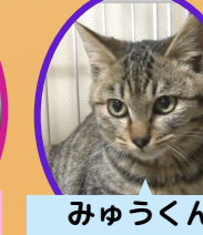
みゆうくん 2歳 去勢済