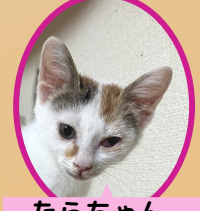
たらちゃん 8月上旬生まれ