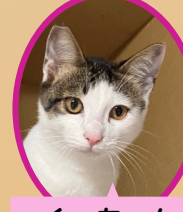
くーちゃん 5月上旬生避妊済