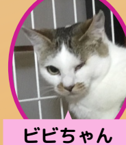
ビビちゃん 1歳 避妊済み