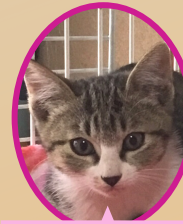
おはぎちゃん 9月上旬生まれ