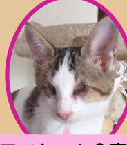
アイちゃん全盲 8月上旬生まれ