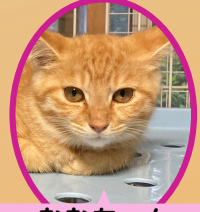
むむちゃん 5月上旬生去勢済