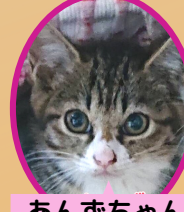
あんずちゃん 4月上旬避妊済