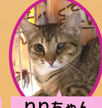
りりちゃん 1歳 避妊済