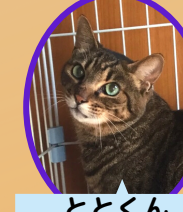
ととくん 13歳位 去勢済