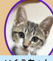
いくらちゃん 8月上旬生まれ