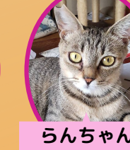
らんちゃん 2歳 避妊済み