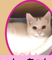
しーちゃん 5月上旬生避妊済