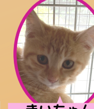
きいちゃん 5月上旬生避妊済