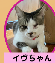
イヴちゃん 1歳 避妊済み