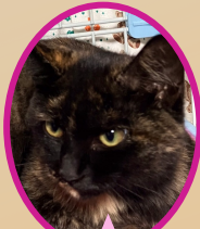
シェルちゃんサビ 8月上旬生まれ