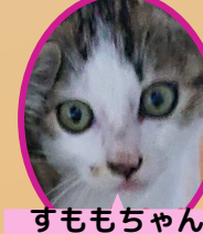
すももちゃん 4月上旬生避妊済