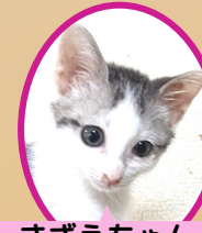
さざえちゃん 8月上旬生まれ