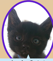
なすびくん 9月上旬生まれ