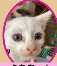
うたちゃん 7月上旬生まれ